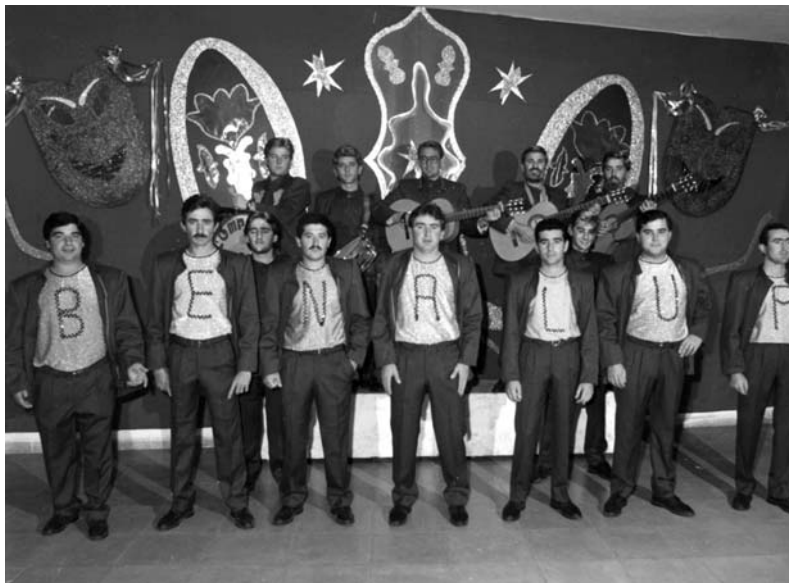
Comparsa Casas Viejas. EXPOSICIÓN 2002