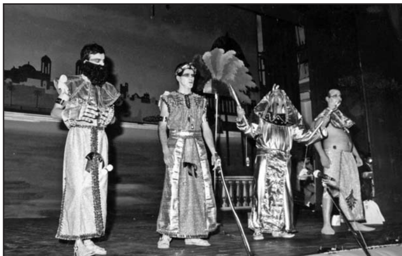
Cuarteto Tut-Am-Amón , el escriba y dos eunucos con el sida. EXPOSICIÓN 2002