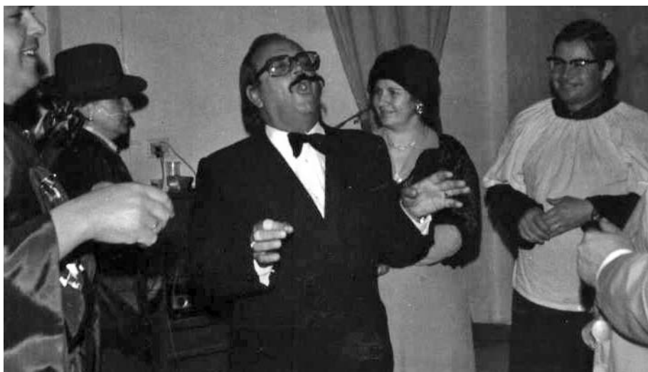
Algunos ejemplos de bailes de disfraces en el Zahori